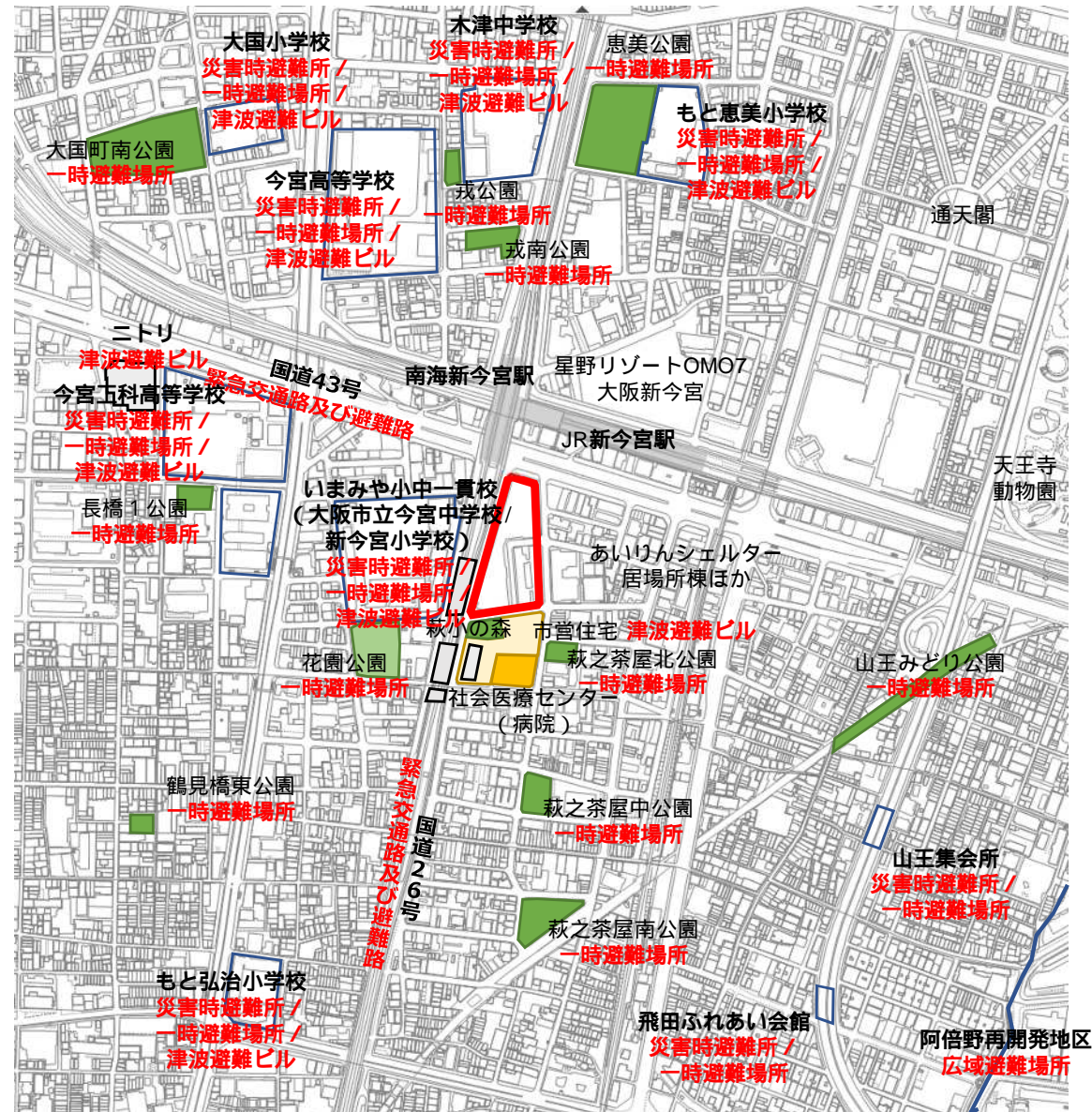
避難場所等の状況

新型コロナウイルス対策などを踏まえた避難所等の確保については、市ほか関係機関で整理を進めている。