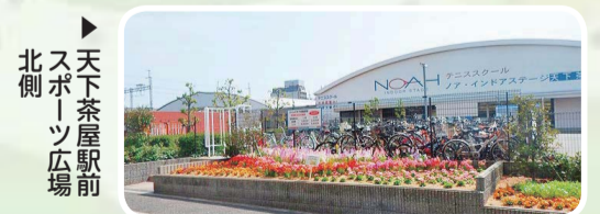
▶ 天下茶屋駅前 北側ポーツ広場