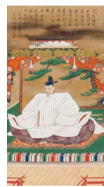
重要文化財「豊臣秀吉像」 慶長3年(1598) 京都・高台寺蔵