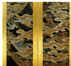
大阪城図屏風 (大阪城天守閣蔵)