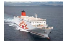
フェリーさんふらわあ