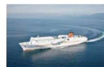
四国オレンジフェリー