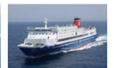
名門大洋フェリー