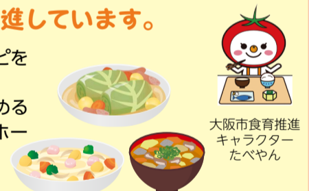
大阪市食育推進 キャラクター たべやん

今年度のテーマは、「よくかんでおいしく食べよう!!」「よく噛める食材を使ったレシピ」を募集します。優秀な作品は「西成区役所ホームページ」「大阪市公式クックパッド」に掲載されます。皆さんのとっておきのアイデア作品をお待ちしています。