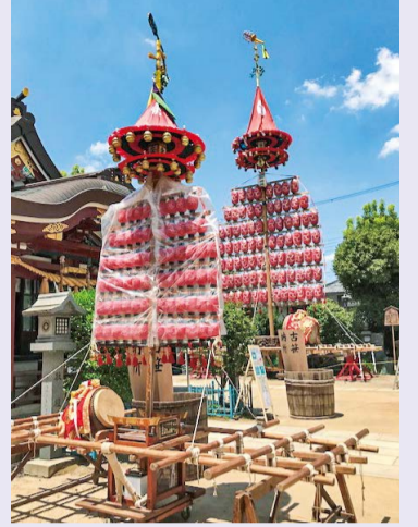
今年の「だいがく」は、規模を縮小して行われました。

区政、区長へのご意見、ご要望をお待ちしています。3営業日以内のご返事をめざしています。→nishinarikucho@gmail.com