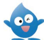
水道局 イメージキャラクター 「びゅあら」

転入者が多い3月・4月は、日曜・祝日も水道の使用開始・中止等の各種届出、漏水の連絡などを受け付けます(月~金は8:00~20:00、土日祝は9:00~17:00)。また、各種届出はHPからも申し込みます。