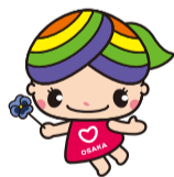
大阪市人権啓発 マスコットキャラクター 「にっこりな」

地域には病気や障がい、介護、子育てなど配慮や支援などが必要な方がいます。過剰な詮索や本人の承諾を得ずに第三者に情報を伝えることは人権侵害につながります。年度替わりを迎え地域の顔ぶれが替わるなか、一人ひとりが地域で快適に暮らせるよう、お互いのプライバシーを尊重しましょう。人権啓発・相談センターでは、専門相談員が人権に関するさまざまな相談をお受けしています(無料・秘密厳守)。☎6532-7830(なやみゼロ)・FAX6531-0666・✉でご相談ください。