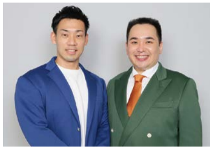
ゲストのミルクボーイ

将来の大阪文化を担う若手芸術家に対して贈る賞。贈呈式では、受賞者5組の活動紹介のほか、令和2年度大衆芸能部門(漫才)受賞者のミルクボーイによる記念ライブを開催。定員400人。