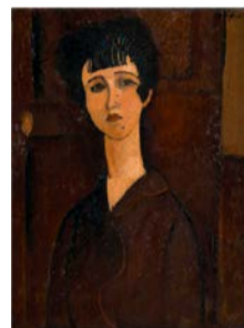
アメデオ・モディリアーニ 《若い女性の肖像》 1917年頃 テート蔵

エコール・ド・パリの一員としてピカソや藤田嗣治などと共に活躍したイタリア出身の画家・モディリアーニの作品を中心に、20世紀前半のパリで開花した芸術の軌跡をたどります。