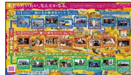
「新今宮ワンダーランド」 WEBサイト、ポスター、リーフレットを作成