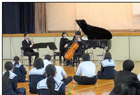
大フィル出前コンサート