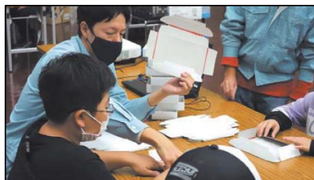
西成しごと博物館