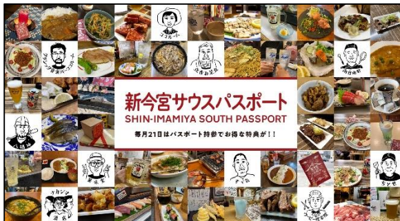
新今宮フェスティバルの開催