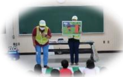
防犯交通安全教室