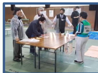
今宮地域防災訓練