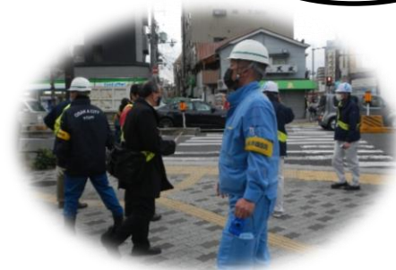
放置自転車合同啓発活動