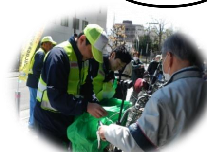
ひったくり防止カバー取付