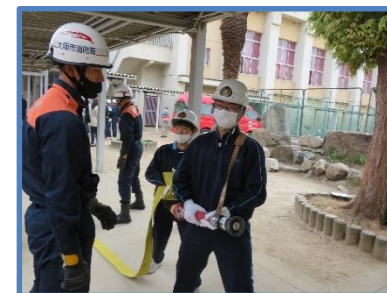
可搬式ポンプ講習