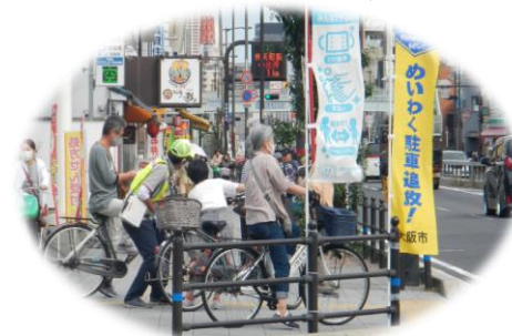
迷惑駐車・駐輪追放キャンペーン