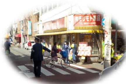
交通安全運動(春) ハンドサイン運動