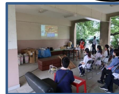
津守地域防災訓練