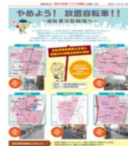
広報紙による自転車特集