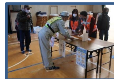
天下茶屋地域防災訓練