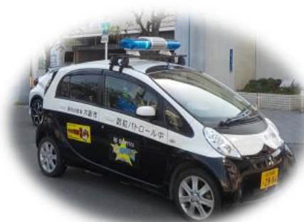
青色防犯パトロール巡回