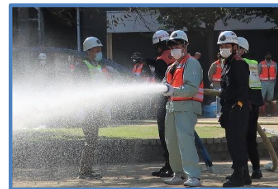
防災アドバンス講習会