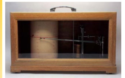
アネロイド型自記気圧計

天気予報に欠かせないさまざまな気象測器の変遷とともに、気象観測方法の原理と、天気予報の中にある科学を紹介します。 ☎6/21(火)~9/4(日)9:30~17:00(入場は16:30まで)、月曜(祝日の場合は翌平日)休館(8/15は開館) ☎観覧料:大人400円ほか ☎場 市立科学館 ☎6444-5656 FAX6444-5657