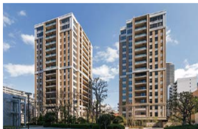
第34回ハウジングデザイン賞 受賞住宅 ※他に特別賞受賞住宅もあり

魅力ある良質な集合住宅を表彰する「大阪市ハウジングデザイン賞」を実施。推薦いただいた方の中から抽選で50人に図書カード(500円分)をプレゼント。 ☎市役所・区役所・大阪市サービスカウンター(梅田・難波・天王寺)などで配布する推薦ハガキ付きリーフレットに必要事項を記入し、6/20までに☎都市整備局住宅政策課へ送付。☎からも申し込み可。 ☎6208-9226 FAX6202-7064