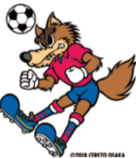
セレッソ大阪 チームキャラクター 「ロビー」

舞洲プロジェクトが開催するサッカースクールの参加者を募集。セレッソ大阪のホームスタジアムでスクールコーチによる実技指導を受けられます。対象は市内在住の小学生。定員150人。 ☎6/26(日) 13:45~15:15 ☎場 ヨドコウ桜スタジアム ☎参加料:2,000円(セレッソ大阪当日試合観戦ペアチケット付き) ☎6/15までにホームページで。 ☎経済戦略局スポーツ課 ☎6469-3882 FAX6469-3898