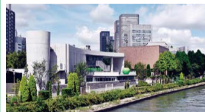
第40回大阪市長賞:こども本の森 中之島 撮影者:安藤忠雄建築研究所

周辺景観の向上に資し、かつ景観上優れた建物やまちなみを推薦していただき、特に優れたものを表彰します。