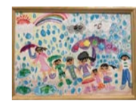
令和3年度 特選賞(1年生)