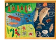
令和3年度 特選賞(4年生)