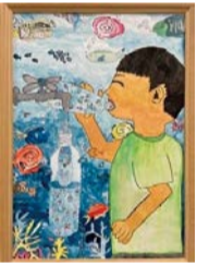
令和3年度 特選賞(5年生)