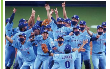
前回優勝チーム:大阪ガス

全32チームが出場し、社会人野球日本一を決定する最高峰の大会のチケットを500組1,000人にプレゼント。対象は市内在住・在勤・在学の方。詳しくは☎をご覧ください。