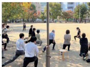
お昼休み☆20分ゆるゆるストレッチ