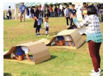
ダンボールキャタピラー

問い合わせ▶建設局調整課 ☎06-6615-6704 FAX 06-6615-6070