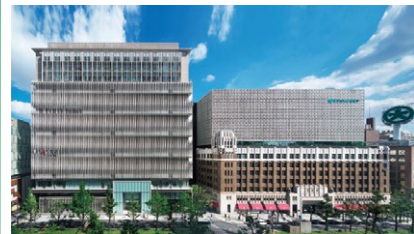
第41回大阪市長賞：大丸心斎橋本店、心斎橋PARCO

周辺景観の向上に資し、かつ景観上優れた建物やまちなみを推薦していただき、特に優れたものを表彰します。