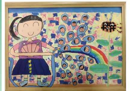
令和4年度 特選賞(2年生)