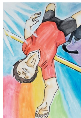
令和4年度 障がい者週間のポスター 小学生部門 最優秀賞作品