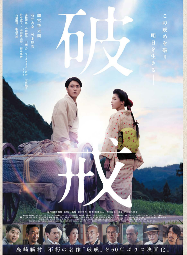
島崎藤村、不朽の名作「破戒」を60年ぶりに映画化。 ©全国水平社創立100周年記念映画製作委員会