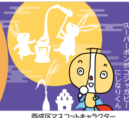
西成区マスコットキャラクター