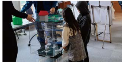
模型による体験の様子

日 10/21(土)・22(日) 10:00～12:00、13:00～15:00 場 下水道科学館 問 建設局調整課 ☎06-6615-6433 FAX06-6615-7690