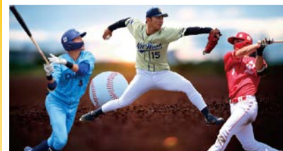
大阪ガス、NTT西日本、日本生命の野球部