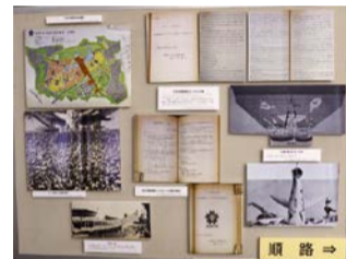
過去の展示の様子

市の歴史や市政に関する理解を深めていただくため、明治から昭和初期に市が主催・後援した博覧会と市の近代都市化について、所蔵する公文書と刊行物を通じて紹介します。ぜひご来館ください。 日 11/1(水)～8(水) 9:00～17:30(入館は17:00まで) 場 問 大阪市公文書館 ☎06-6534-1662 FAX06-6534-5482