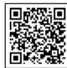
↑個人市・府民税の税制改正内容

問合せ あべの市税事務所 市民税等グループ(個人市民税担当) ☎06-4396-2953 [平日9:00~17:30 (金曜日は9:00~19:00)]