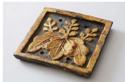
金箔桐文方形飾瓦 大阪市指定文化財 豊臣時代 大阪歴史博物館保管

豊臣秀吉が造った大坂城を象徴する金箔瓦や武家屋敷の屋根を飾った家紋瓦などの発掘資料を展示し、大坂城と城下町の姿を紹介します。 📅 3/6(水)～5/6(月・休)9:30～17:00(入館は16:30まで) 💰 大人 600円ほか 📍 場 問 大阪歴史博物館 ☎06-6946-5728 ☎06-6946-2662