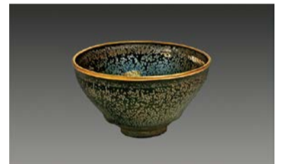
国宝 油滴天目茶碗 南宋時代・12-13世紀 建窯 大阪市立東洋陶磁美術館 (住友グループ寄贈/安宅コレクション)

📅 4/12(金)～9/29(日)9:30～17:00(入館は16:30まで)、月曜(祝日の場合は翌平日)休館(4/30は開館) 💰 大人1,600円ほか 📍 場 問 東洋陶磁美術館 ☎06-6223-0055 ☎06-6223-0057