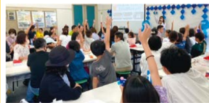
クイズ大会の様子

小学生を対象に、水に関するワークショップや体験型のイベント、謎解きなどを開催。定員各回70人。