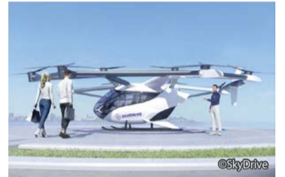
空飛ぶクルマの機体イメージ