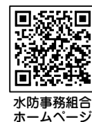
水防事務組合 ホームページ