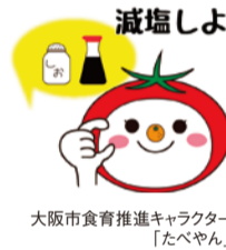
大阪市食育推進キャラクター「たべやん」

食塩の摂りすぎは循環器疾患やがんとの関連が大きいといわれています。高血圧など生活習慣病予防のために、普段の食生活を見直し、できることから始めてみましょう。簡単な減塩のコツなど詳しくはHPをご覧ください。