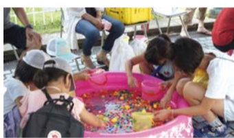
受賞住宅での夏祭りの様子

魅力ある良質な集合住宅を表彰する「大阪市ハウジングデザイン賞」を実施。推薦いただいた方の中から抽選で50人に図書カード(500円分)をプレゼント。