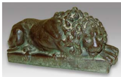
天岡均一作「ライオン像」(ブロンズ製)明治～大正時代 九鬼隆章氏蔵

ライオン像などの彫刻や絵画、陶磁器を手がけ、俳人でもある天岡均一の希少な作品を紹介します。