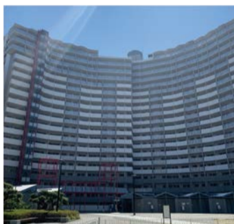
第36回ハウジングデザイン賞 特別賞受賞住宅 ペインティ大阪