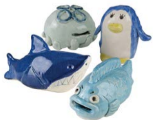
陶器の貯金箱作品イメージ

吹きガラス・陶芸・染色・織物・木工・金工など11種類の本格的な工芸体験ができる体験教室。定員4～28人(先着順)。空きがあれば当日参加もできます。各教室の対象年齢や費用など、詳しくは☎をご覧ください。