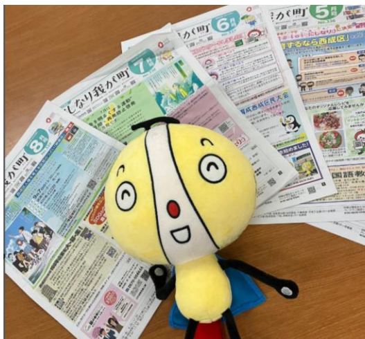
インスタグラムの投稿内容