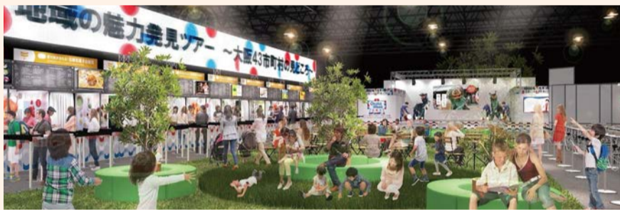
地域の魅力発見ツアー会場イメージ

皇室や伊勢神宮に献納してきた、東成区・深江の菅笠・菅細工の展示とワークショップを行います。