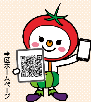
大阪市食育推進キャラクター たべやん