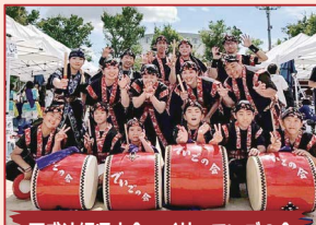
西成沖縄県人会エイサーでいごの会