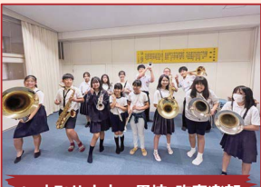
いまみや小中一貫校 吹奏楽部