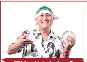
デビッドちんすこう