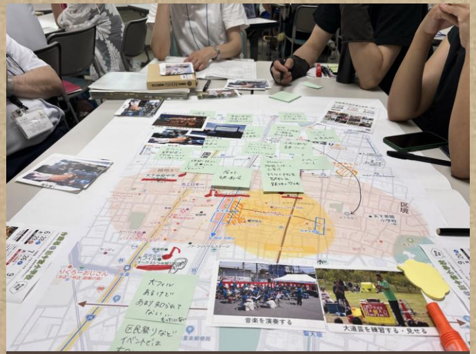
▲ワークショップの様子 たくさんのアイデアを出し合いました！

天下茶屋の地域の人やお店、活動団体のみなさんと一緒に、まちをもっと楽しくするアイデアを考えるワークショップ「ガチャのピン」。このワークショップで出た「やってみたい！」という声を、今年の秋頃に予定している社会実験「天下茶屋フェス（仮）」で実際にカタチにしていきます。第2回のワークショップは、7月2日（水）に西成区民センターで開催され、「天下茶屋がこうなったらいいな」という想いをもとに、実現に向けた具体的なアクションを参加者のみなさんと考えました。