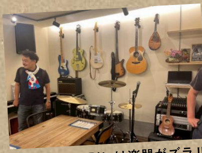
▲CAFE AKARIには楽器がズラリ！