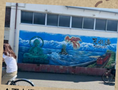
▲天水湯の壁画アート！