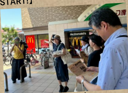
▲天下茶屋駅前集合

6月28日(土)、ワークショップで話題に挙がった場所を中心に天下茶屋エリアのいろいろな場所を巡りました！