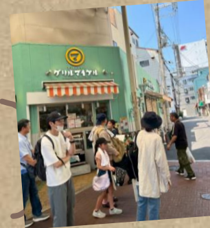
▲おいしいお店がたくさん