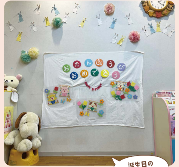
誕生日の記念撮影場所♪

申込み・問合せ 保健福祉課(地域保健活動) 2階22番窓口 ☎06-6659-9968