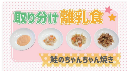
鮭のちゃんちゃん焼き