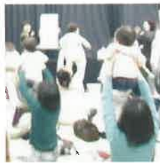
赤ちゃんは「びよーん」が大好き!