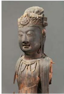
重要文化財 木造観音菩薩立像(部分) 隋時代 大阪・堺市博物館

日本の仏像に大きな影響を与えた中国の仏像・仏画。南北朝時代から明・清時代まで1000年を超える仏像の移り変わりを、関連する日本の仏像とともにご紹介。 日 12/8(日)まで 9:30~17:00(入館は16:30まで)、月曜休館(月曜が祝日の場合は翌平日) 場 市立美術館 ￥ 大人1,400円ほか 問 大阪市総合コールセンター ☎4301-7285 FAX6373-3302