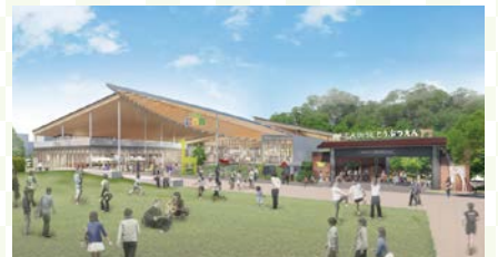
てんしばi:na完成予想イメージ