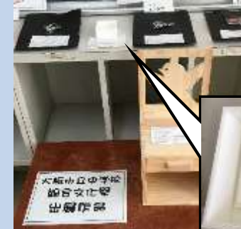
大阪市立中学校総合文化祭での出展作品！