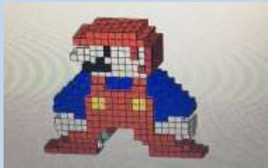
生徒が3Dモデル作成ソフトで作成！