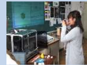
保護者の方も興味津々！