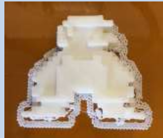
区役所において3Dプリンタで出力！