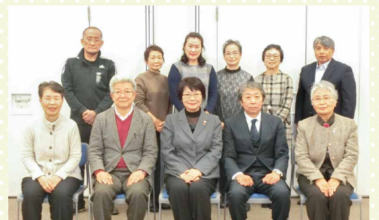
西淀川区民生委員児童委員協議会 各地区委員長

☎ 西淀川区民生委員児童委員協議会事務局(保健福祉課 福祉グループ 2階21番内) ☎6478-9969