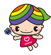
大阪市人権啓発マスコットキャラクター「にっこりな」

地域には病気や障がい、介護、子育てなど配慮や支援が必要の方がいます。過剰な詮索や本人の承諾を得ずに第三者に情報を伝えることは人権侵害につながります。年度替わりを迎え地域の顔ぶれが替わるなか、一人ひとりが地域で快適に暮らせるよう、お互いのプライバシーを尊重しましょう。人権啓発相談センターでは、専門相談員が人権に関するさまざまな相談をお受けしています(無料・秘密厳守)。☎ 6532-7830(なやみゼロ)・☎ 6531-0666・✉でご相談ください。