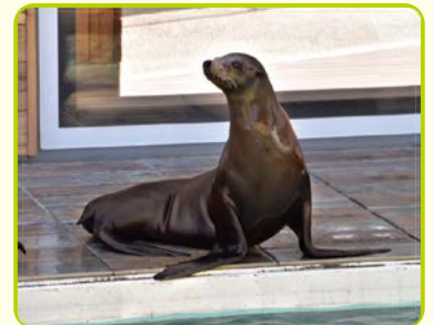
カリフォルニアアシカ