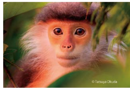
アカアシドゥクラングール

写真家の奥田達哉さんが東南アジアのジャングルで撮影した霊長類の絶滅危惧種の写真の中から、ユニークな約10種を20m以上にわたる壁面大型写真パネルで展示します。