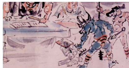
地こく変(部分) 菅橋彦筆 明治41年(1908) 大阪歴史博物館蔵

天変地異や災厄の原因を理解し、生の苦しみや死の恐怖を克服するために、人々は「異界」についてどのように捉え、交渉し、また対応してきたのかを民俗・歴史・考古・美術などさまざまな資料から考えます。