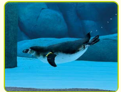
ファンボルトペンギン

¥ 入園料:大人500円ほか 場 問 天王寺動物園 ☎06-6771-8401 FAX06-6772-4633