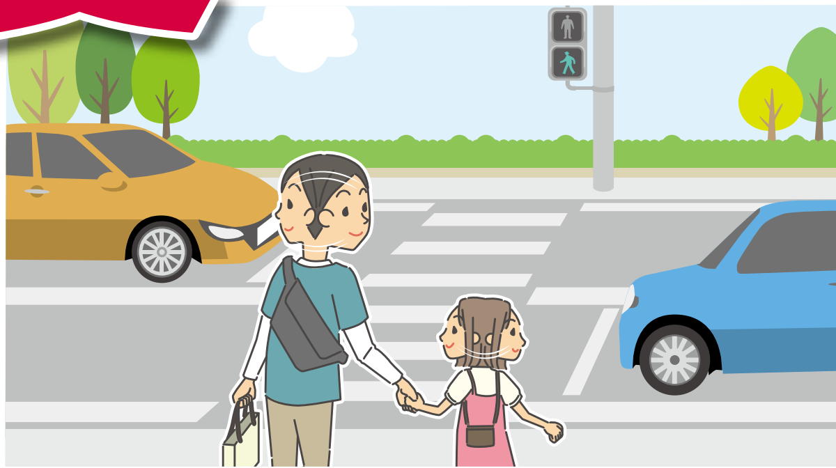
こどもの交通事故防止