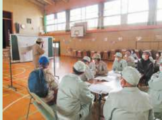
避難所開設訓練の様子

是非とも防災訓練にご参加いただき、防災について考えるきっかけにいただければと思います。