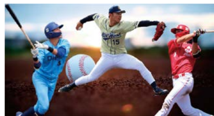
大阪ガス、NTT西日本、日本生命の野球部