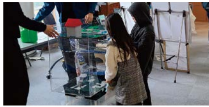
模型による体験の様子