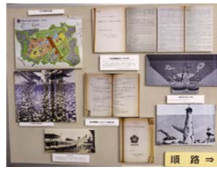
過去の展示の様子

市の歴史や市政に関する理解を深めていただくため、明治から昭和初期に市が主催・後援した博覧会と市の近代都市化について、所蔵する公文書と刊行物を通じて紹介します。ぜひご来館ください。