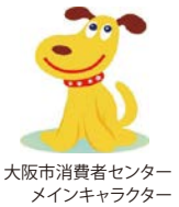
大阪市消費者センター メインキャラクター エルちゃん

「スマホでSNSの広告を見て、化粧品を1回だけのつもりで購入したが、定期購入契約になっていた」などのトラブルが増えています。困ったら、気軽にご相談ください。消費生活相談は市内在住の方に限り、☎・面談(事前予約制)・☑で行っています。 ☑ 月～土曜10:00～17:00(祝日除く) ☑ 大阪市消費者センター消費生活相談専用電話 ☎ 06-6614-0999 ☎ 06-6614-7525