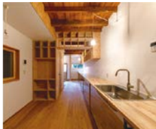
改修イメージ(改修前→改修後)