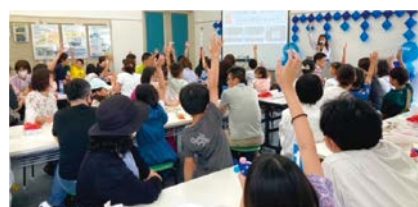
クイズ大会の様子

小学生を対象に、水に関するワークショップや体験型のイベント、謎解きなどを開催。定員各回70人。 ☎ 6/15(土)・16(日)各日10:00～