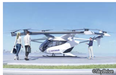
空飛ぶクルマの機体イメージ