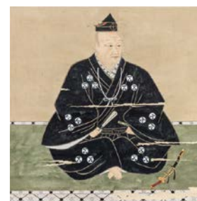
毛利元就画像(大阪城天守閣蔵)

毛利元就、武田信玄、上杉謙信など、有名な戦国大名の資料を紹介しながら、戦国時代の合戦がどのようなものであったのか、さぐっていきます。 ☎ 5/8(水)～7/24(水)9:00～17:00(入館は16:30まで) ☎ 入館料: 大人 600円