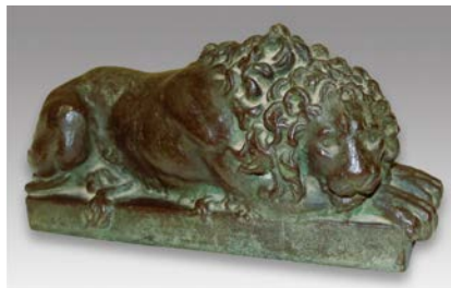
天岡均一作「ライオン像」(ブロンズ製)明治～大正時代 九鬼隆章氏蔵

ライオン像などの彫刻や絵画、陶磁器を手がけ、俳人でもある天岡均一の希少な作品を紹介します。