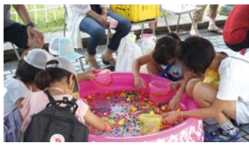
受賞住宅での夏祭りの様子

魅力ある良質な集合住宅を表彰する「大阪市ハウジングデザイン賞」を実施。推薦いただいた方の中から抽選で50人に図書カード(500円分)をプレゼント。