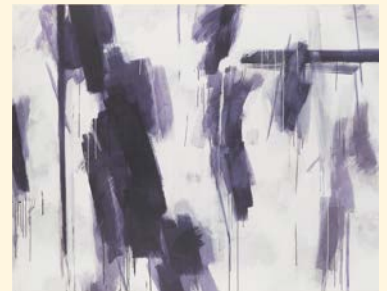
木下佳通代「LA 92-CA681」1992年 大阪中之島美術館蔵

8/18(日)まで10:00～17:00(入場は16:30まで)、月曜休館(7/15・8/12は開館) 大人1,600円ほか