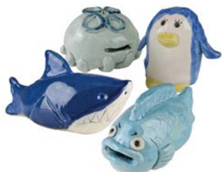
陶器の貯金箱作品イメージ

吹きガラス・陶芸・染色・織物・木工・金工など11種類の本格的な工芸体験ができる体験教室。定員4～28人(先着順)。空きがあれば当日参加もできます。各教室の対象年齢や費用など、詳しくはHPをご覧ください。