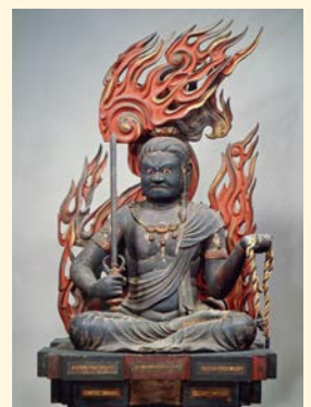
重要文化財(不動明王坐像 快慶作)建仁3年(1203) 画像提供:奈良国立博物館(通期展示)

大阪市総合コールセンター ☎06-4301-7285 ☎06-6373-3302