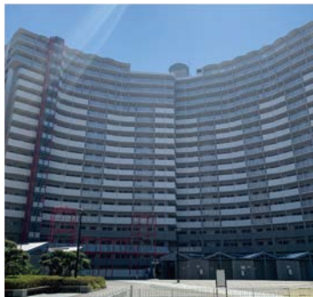
第36回ハウジングデザイン賞 特別賞受賞住宅 ベイシティ大阪