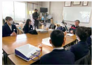
中学生が工場長さんにインタビューをする様子

地域とのつながりができました。また、沿道などがきれいになることによって、ごみがちょっとずつ減ってきたように思います。きれいなところにごみ捨てにくいので、私たちがきれいにするによって、そういう環境ができてきたと思います。