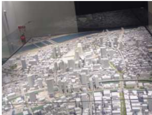
【グランフロント大阪 大阪駅周辺地域模型】