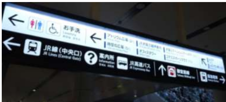
【大阪ステーションシティ サイン】