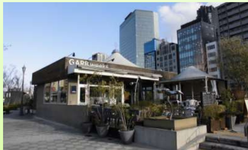
民間事業者による便益施設の事例(中之島公園)