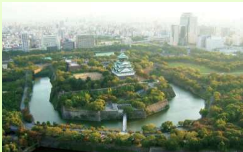
民間事業者による管理運営の事例(大阪城公園)