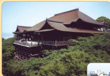
きよみずでら 清水寺