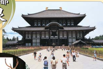
とうだいじだいぶつでん 東大寺大仏殿