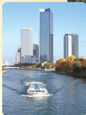
大阪ビジネスパーク (OBP)