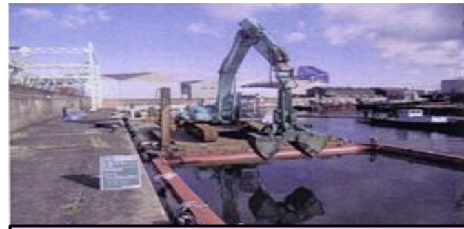
浚渫船による汚染底質の除去