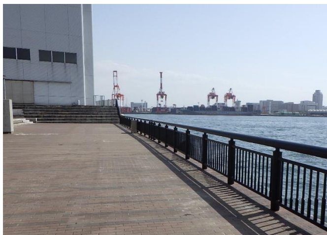
港区（中央突堤臨港緑地）