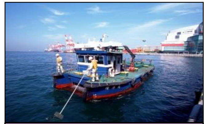
清掃船による港内清掃