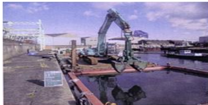
浚渫船による汚染底質の除去