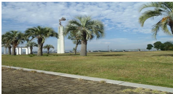
此花区(常吉西臨港緑地)