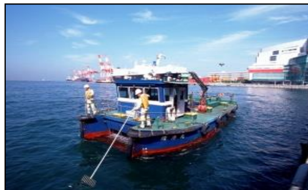
清掃船による港内清掃