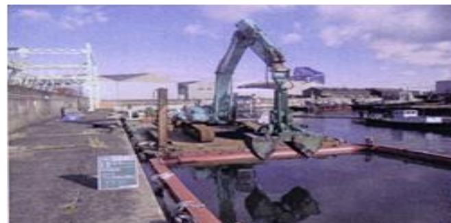
浚渫船による汚染底質の除去