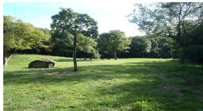
住之江区(野鳥園臨港緑地)