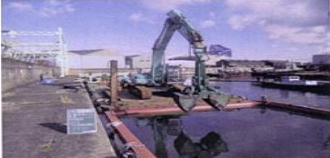
浚渫船による汚染底質の除去