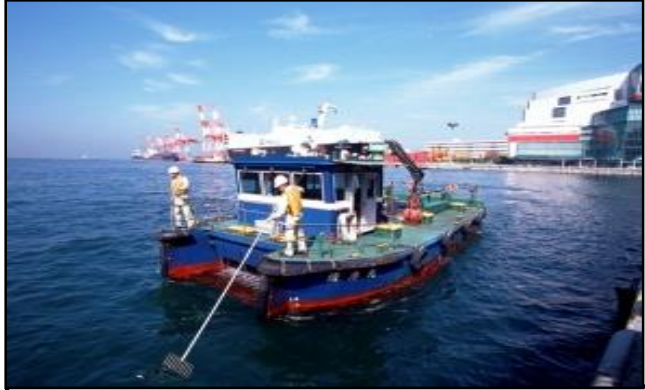
清掃船による港内清掃